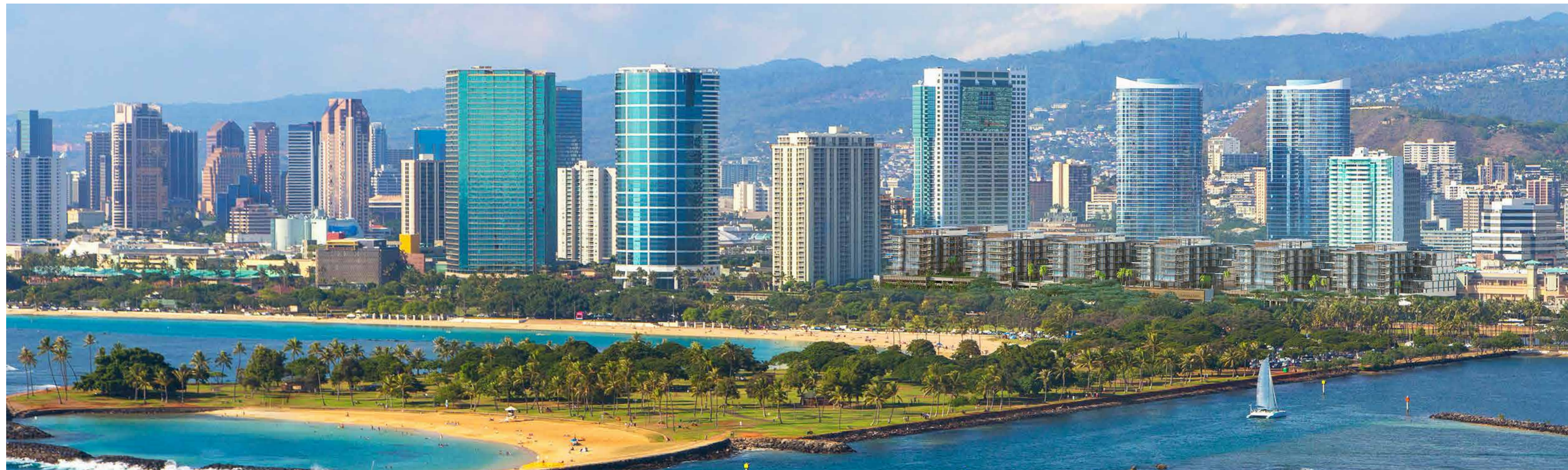
アラモアナ・ビーチパークとパークレーン・アラモアナ（予想図）