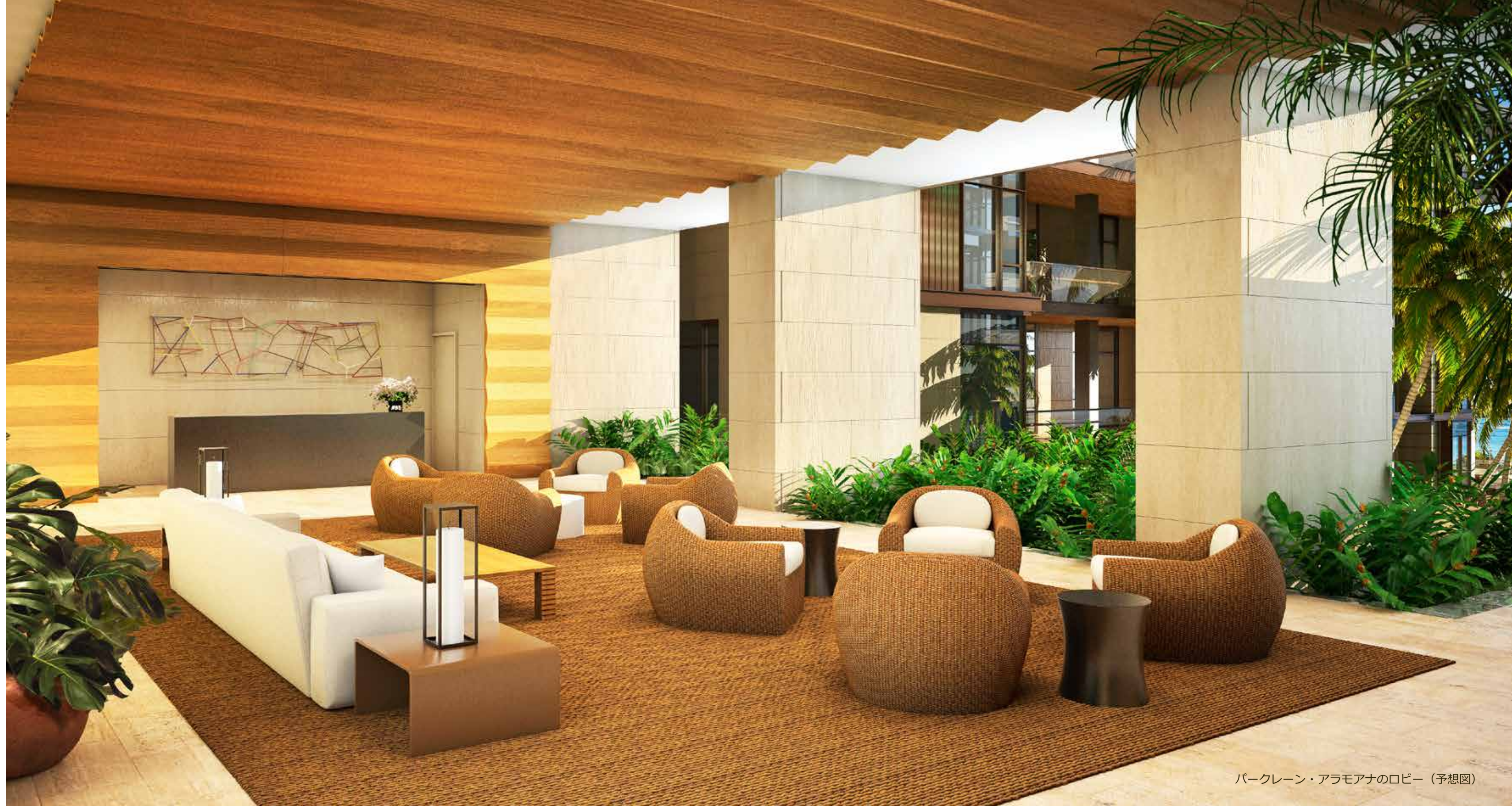
パークレーン・アラモアナのロビー（予想図）