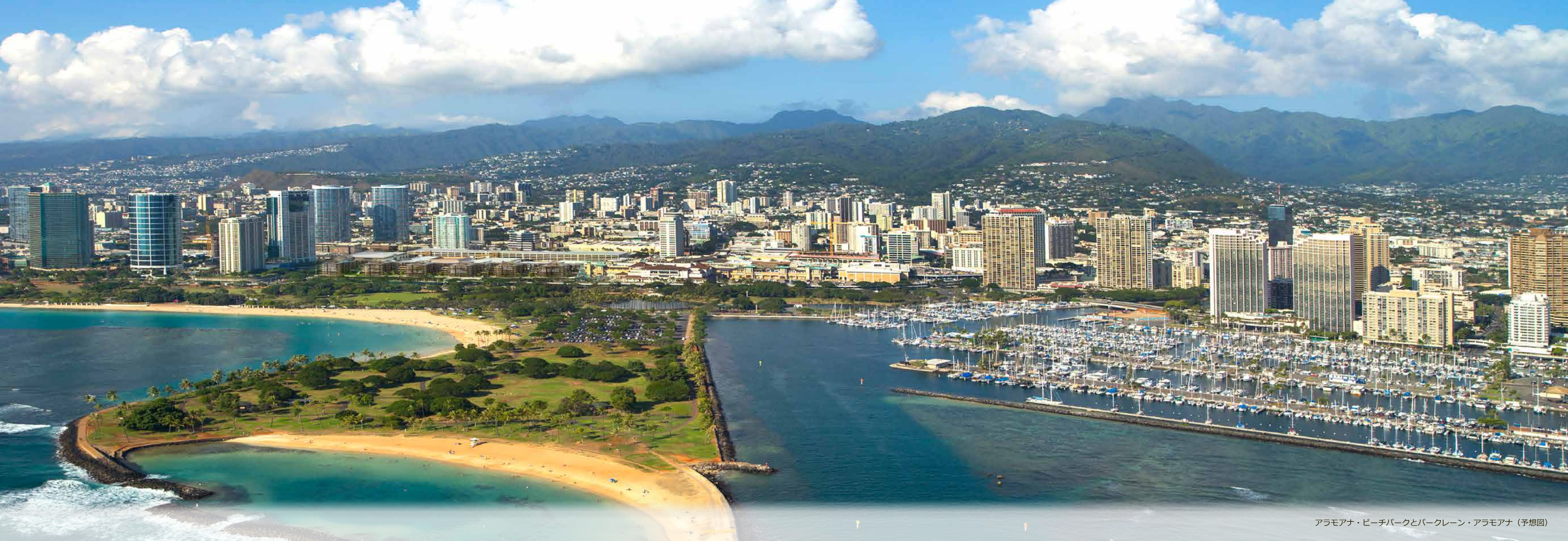
アラモアナ・ビーチパークとパークレーン・アラモアナ（予想図）