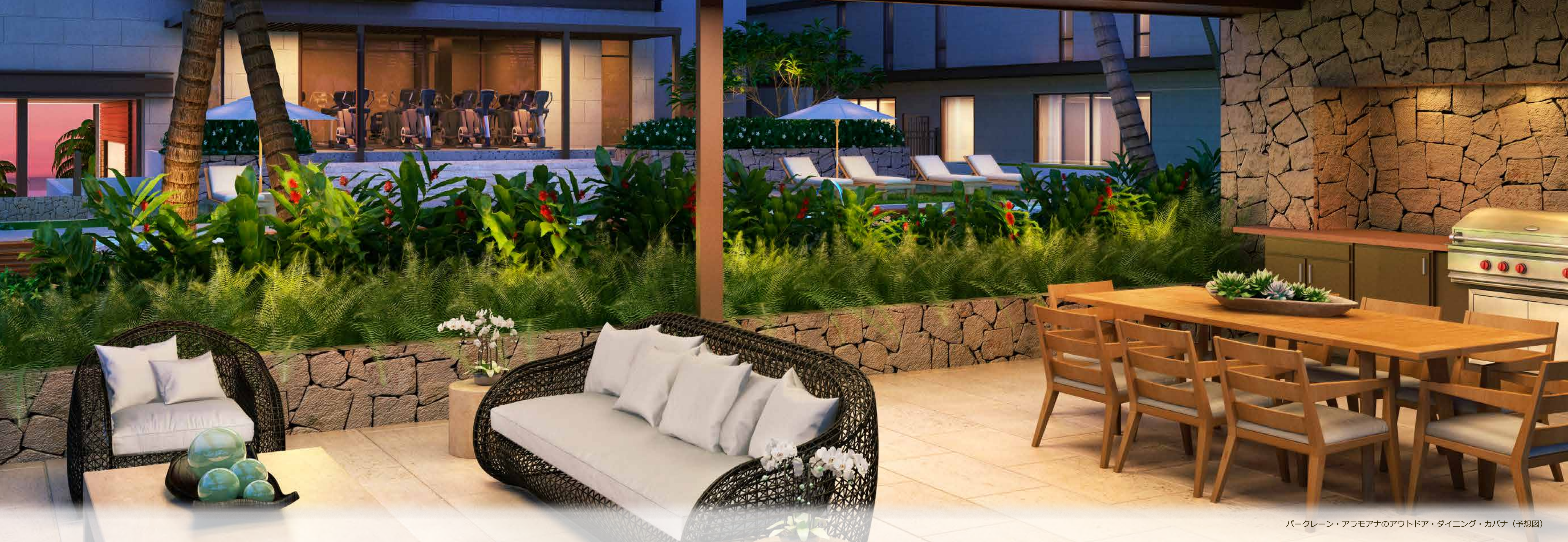
パークレーン・アラモアナのアウトドア・ダイニング・カバナ（予想図）