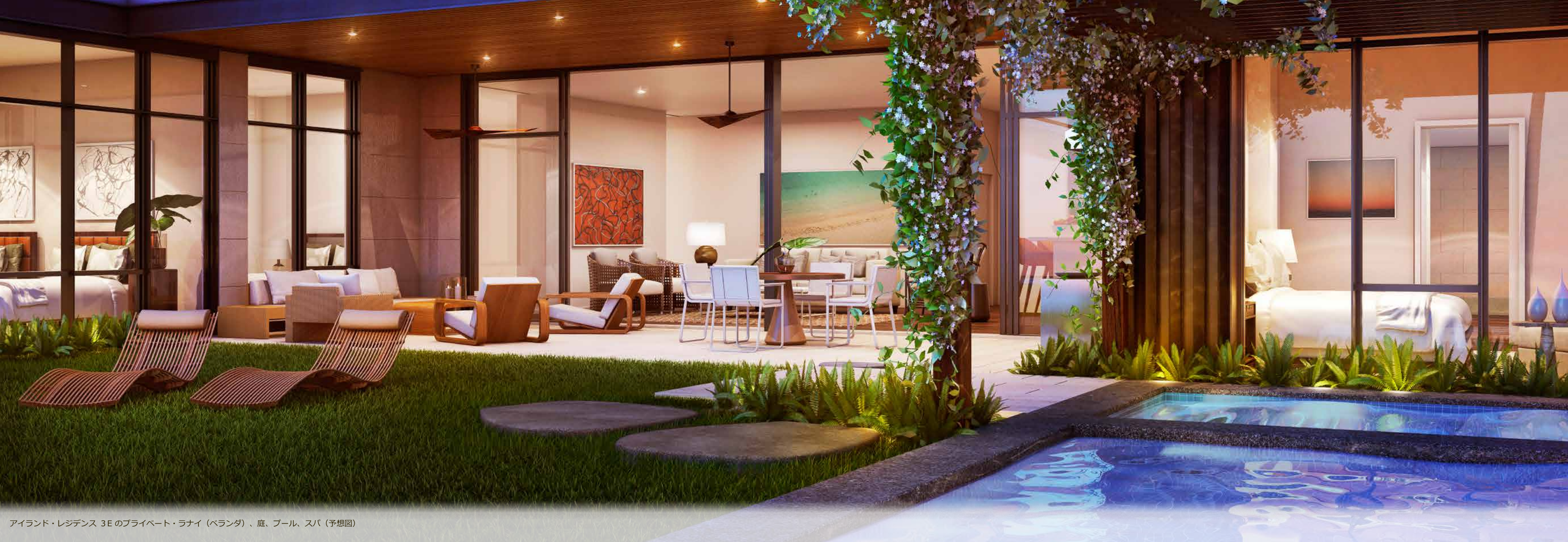
アイランド・レジデンス 3Eのプライベート・ラナイ（ベランダ）、庭、プール、スパ（予想図）