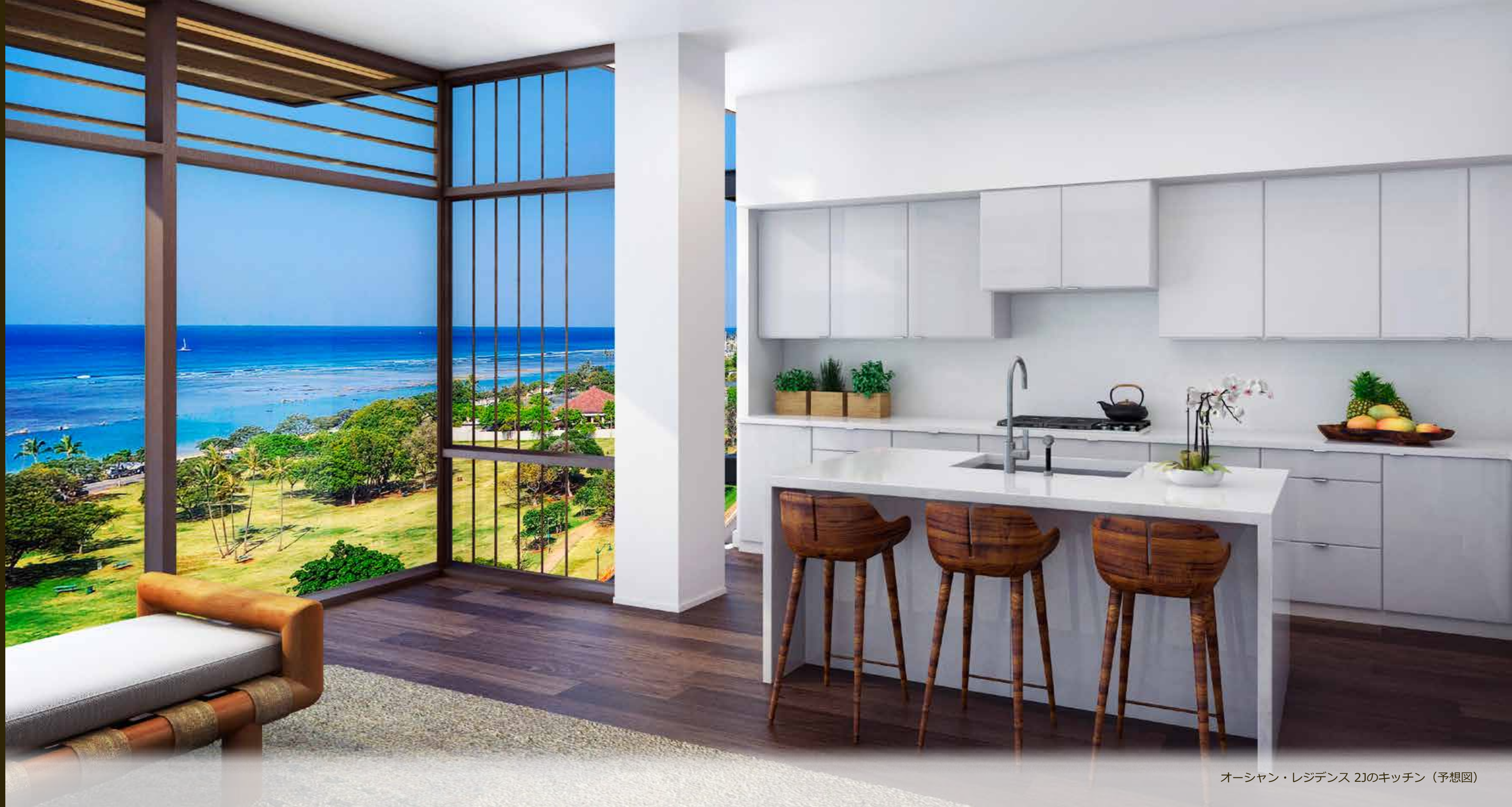
オーシャン・レジデンス 2Jのキッチン（予想図）

ハワイの卓越した高級コンドミニアムの新たなビジョン、 それは、幾世代にもわたってご家族にご利用いただける継続的資産になるでしょう。