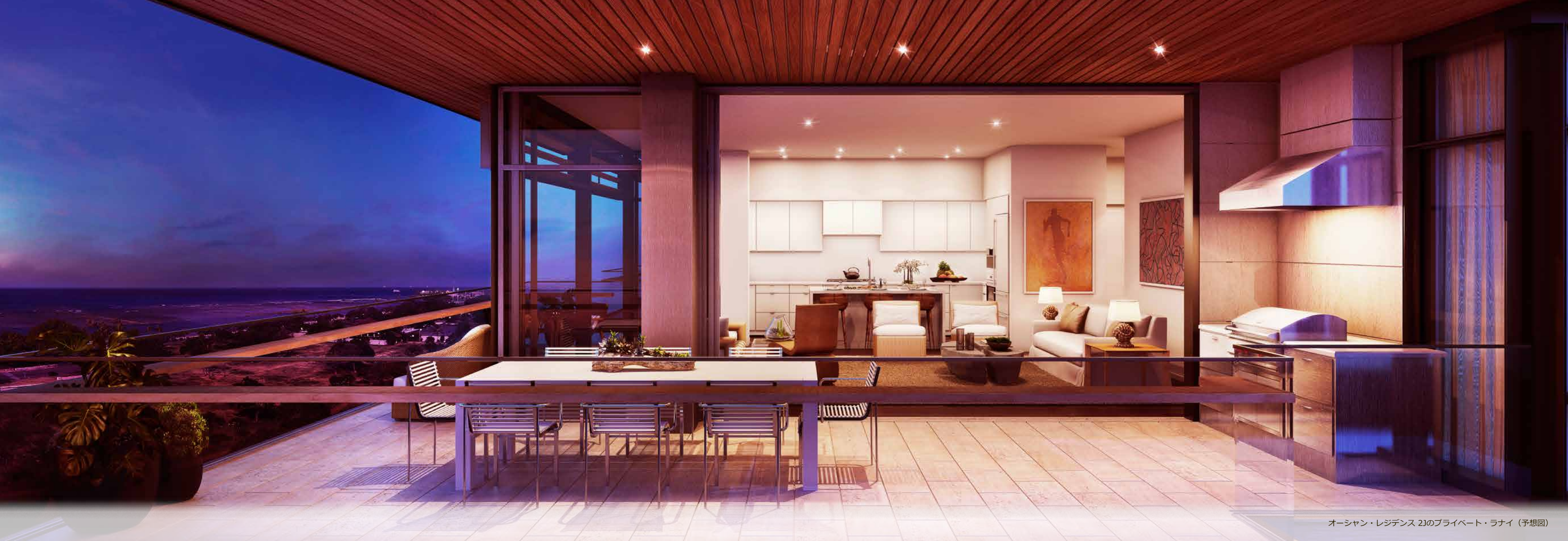
オーシャン・レジデンス 2Jのプライベート・ラナイ（予想図）